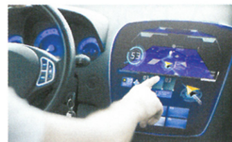
Application d'IME automobile.

En intégrant de façon intime les fonctions électroniques et mécaniques, cette technologie ouvre de nouvelles perspectives pour le développement de produits plastiques intelligents, utilisables par